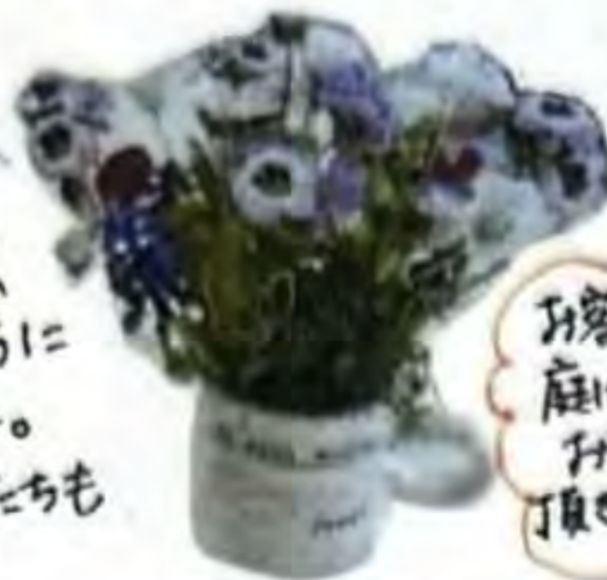
お客様の 庭に咲かせ た花も 頂戴です♡

連日のコロナ関連のニュースで、不安は毎日が続く中、 工場前を通る高校生たちが、少しでも明るい気持ちに なってくれたら...と、花壇に花を植え育てました。 幸い、卒業式や入学式が中止になることもなく、花たちも お祝いするかの如くに咲き誇ってくれました。